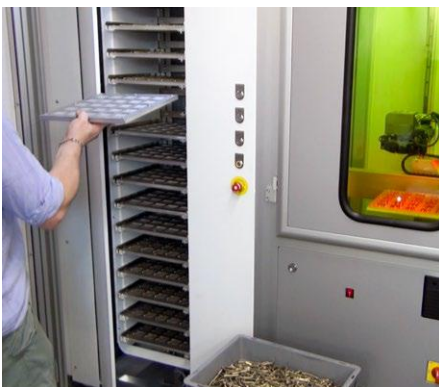
Loading/unloading during operation Be- und Entladens während des Betriebes

Integriertes Koaxial-Vision-System mit hoher Präzisionszentrierung und automatischer Erkennung der Stücke, Steuerungsschnittstelle, die die Markierung der Auftragsverwaltung für jede Palette ermöglicht (auch während des Betriebs).