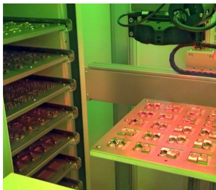
Different objects on each pallet Verschiedene Objekte auf jeder Palette